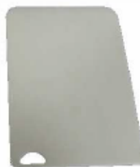
b. Planche à découper