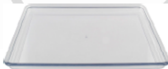
a. Plateau récupérateur