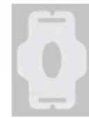
c. Outil de démontage de la lame